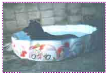
陽光台のK様のルーシーちゃん。お水が大好きで、もう少し若い時(?)は川にも飛び込んだそうです

あで気だり りすてとす す。す。性 す。男、。社 。カ、性メ あ二魚社ガ とッ員かネ 家ノ見か奥 力にるら奥 屋はの何は 上自も故い で信苦かい 天が手人男