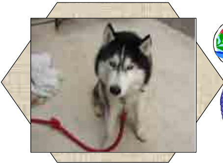
ロッキーくん。13才男の子シベリアンハスキー。甘えん坊で、好きな食べ物はささみです