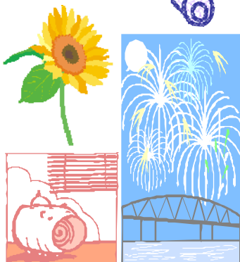
相模原市在住のI様。おとなしいと思っただらう。花鈴